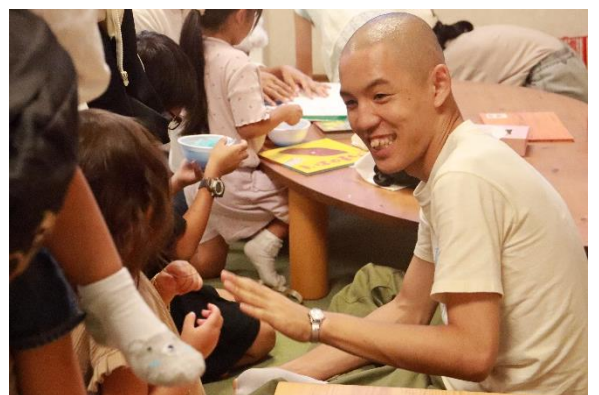
▲子どもたちとふれ合うひと時!

電話：080-4933-6660（かぎき） インスタ：@marusankakusikaku25