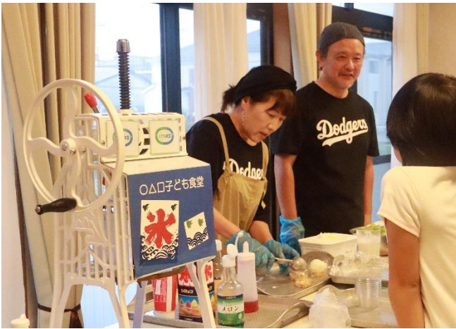
▲かき氷やアイスが大人気!

『絵本はこころのごはんです』をコンセプトに毎回絵本と一緒に様々なイベントを開催しています。週の真ん中、働くおうちの人々がほっと一息「今日のご飯作らなくていいよ」とお子さんと笑顔を交わせる時間のお手伝いをしています。毎月第4水曜日に開催しています。また、季節に合わせたミニイベントなども開催しています。