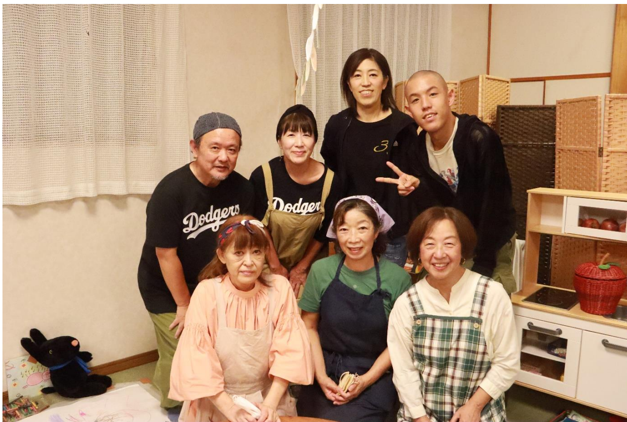
～○△□子ども食堂の皆さんと四千頭身の都築さん・お母さんと一緒に記念写真～