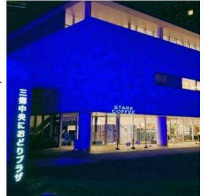
▲ブルーライトアップの様子