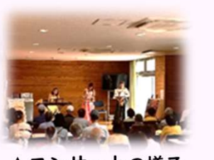
▲コンサートの様子

希望の郷交流センターでは初めてのコンサートの開催でしたが、107人の方々にご参加いただくことができました。参加者の皆さまは素晴らしい音色に耳を傾けられ、手拍子する場面もありながら、ブランチコンサートを楽しんでいらっしゃいました。