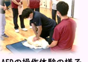
▲AEDの操作体験の様子

参加者の皆さまより、「とても勉強になった」「定期的にAEDに触れる機会がほしい」などの感想をいただきました。