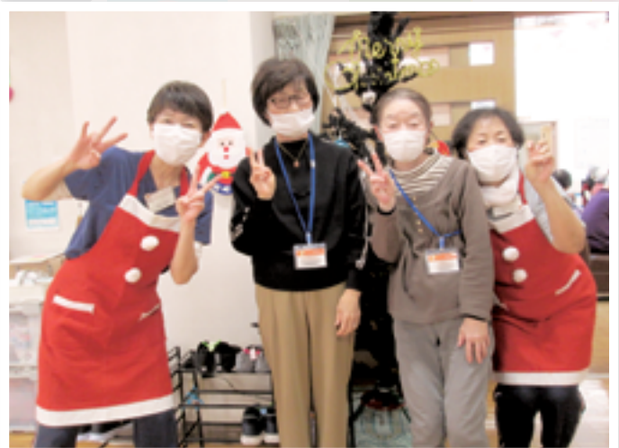
▲地域の皆さんが共に楽しめる季節ごとのさまざまなイベントを開催しています。 写真左：みんなでたのしむクリスマス(4ページ)、写真右：合同クリスマス会(8ページ)