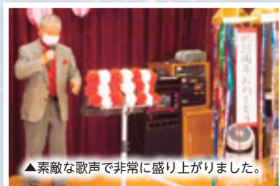
▲素敵な歌声で非常に盛り上がりました。

今後も利用者の皆さんに喜ばれる施設を目指してまいります。関係者の皆さん、ご協力ありがとうございました。