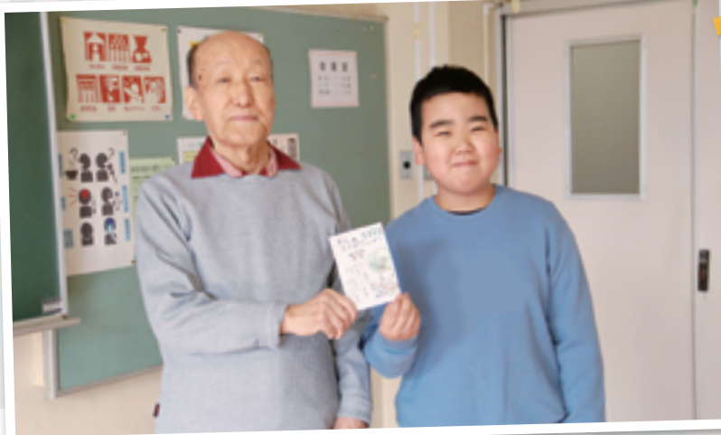
▲毎年、ボランティアや市内小中学校の協力のもと、要援護高齢者実態調査に登録するひとりぐらし高齢者へ年賀状をお送りしています。

今年も 地域の皆さんと共に ふくし だんの らしの あわせ をサポート してまいります