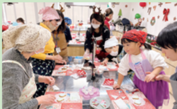
▲子どもから大人まで一緒にアイシングクッキーをつくりました。

午後には、北児童館で『楽器づくり』を行い、その後『みんなでつくる演奏会』が開催されました。(一社)音あそびラボのステージ演奏では、来場者は演奏に耳を傾けたり、イベントで手作りした楽器を鳴らして楽しんだり、さまざまな世代のかたが共に楽しむことのできる素敵な演奏会となりました。来場者からは「大人も楽しむことができた!」「また演奏会を開催してほしい」という声をいただきました。