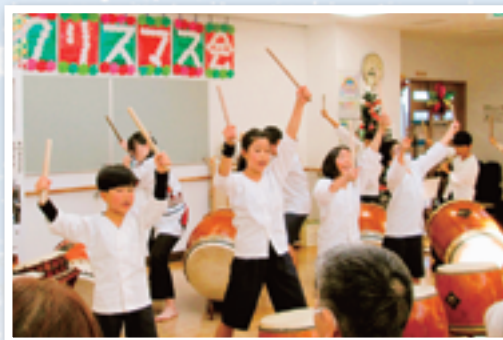
▲子どもたちの力強い演奏に圧倒されました。

戸ヶ崎老人福祉センターと戸ヶ崎老人デイサービスセンターでは、昨年12月14日(土)に令和6年度合同クリスマス会を行いました。