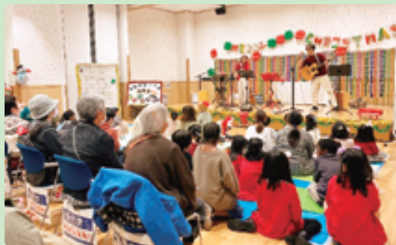
▲クリスマスソングを聴き、みんなで楽しみました。