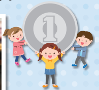
◀小さな手でギューッと握りしめ温められた、たくさんの一円玉が手渡されました。ご協力ありがとうございました。