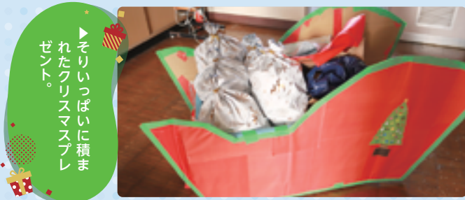
▶そりいっぱい積まれたクリスマスプレゼント。

今回の交流会のテーマはクリスマスパーティー。まず、参加者全員でケーキにデコレーションしてお祝いしました。すると、職員が扮したサンタとトナカイが、そりいっぱいプレゼントを積んで登場！袋いっぱいのプレゼントを受け取った子どもたちは大喜びでした。なお、今回のプレゼントは、すべて市内の企業や団体からご寄付いただいたものです。