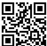
↑メールアドレスリンク