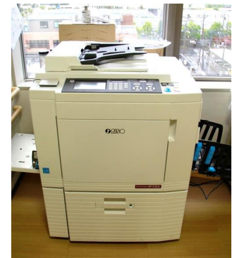
▲今年2月に新機種を導入しました!