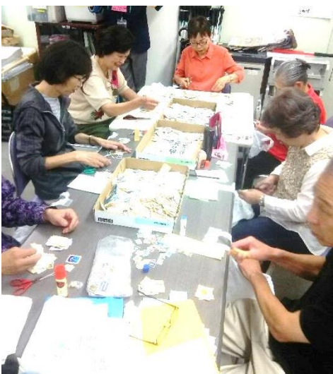
▲使用済み切手の仕分け活動

◎切手の四方に5mmから1cm余白がある ※封筒からはがさず余白を残してください