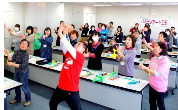
▲昨年度「バルーンアート講座」の様子