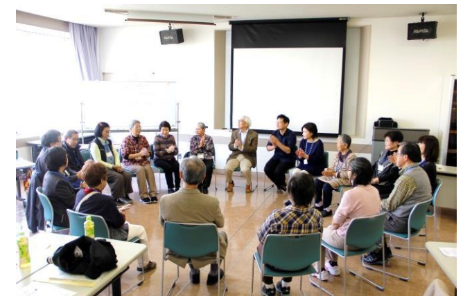
▲昨年度「ふくし講座」の様子

今回、市民のみなさんと協働して、この講座を企 画しました。当事者である子どもや親、そこに関 わる人たちの思いを引き出し、みんながイキイキと過 ごせる場づくりについて考えます。