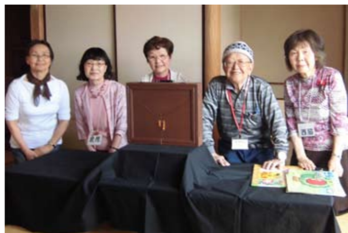
▲定例会では実際に上演し、みんなで工夫しながら練習しています