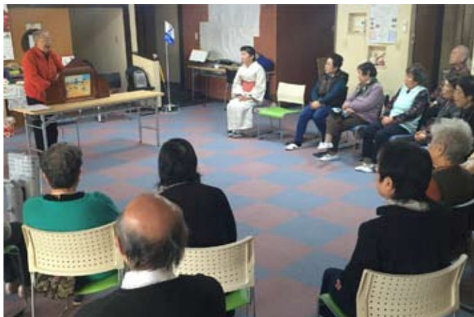
▲あったかサロン早稲田で紙芝居を披露

一緒に活動してくれる メンバーを募集してい ます。お気軽に問い合 わせください。