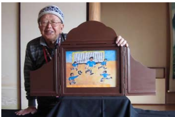
▲オリジナルの紙芝居も制作しています

紙芝居を上演しているボランティアグループです。 毎回 3~4 人のメンバーが、老若男女が楽しめる国内 外の民話、童話、文学作品、知育、創作ものを題材 とする紙芝居作品を15~30分くらい上演しています。 活動先でたくさんの笑顔に出会え、観客はもちろん、 自分自身も張り合いができ、元気になります。 昨年度は実績が評価され、埼玉県知事から文化 ともしび賞をいただきました。 どなたでも参加できる活動です。日本の独自文化 紙芝居と一緒に楽しみませんか？ ご連絡をお待ちしています。