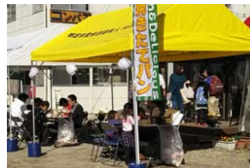
焼きたてパンの販売も行います