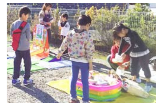
ゲームコーナーも人気です