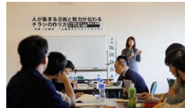
人が集まる企画と魅力が伝わるチラシの作り方

ボランティアグループや町会等で活動中の方が参加しました。 人が集まる企画と魅力が伝わるチラシの作り方講座の内容を2、3ページでご紹介します。