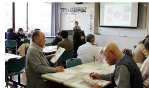
暮らしと地域を豊かにするボランティア活動