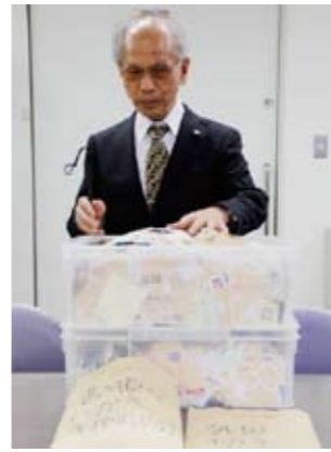
▲使用済切手7kg、書き損じ葉書119枚、未使用切手106枚を寄贈しました

同協会は、葉書の売却と愛好家への使用済切手(国内切手1kg8000円、外国切手1kg10000円)