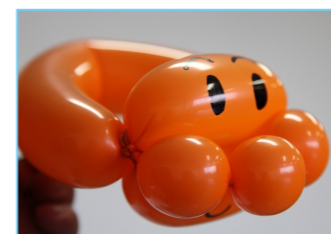
ハートを作っています