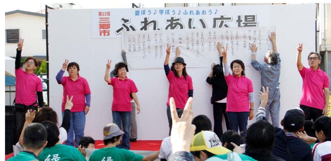
三郷市聴覚障害者の会&三郷市手話サークル「さくら草」のステージ発表。名曲「上を向いて歩こう」を手話で