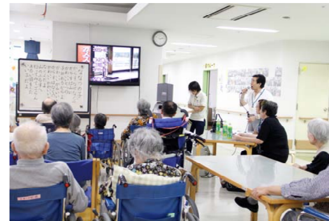
▲利用者のかたと一緒に(三郷ケアセンターにて)