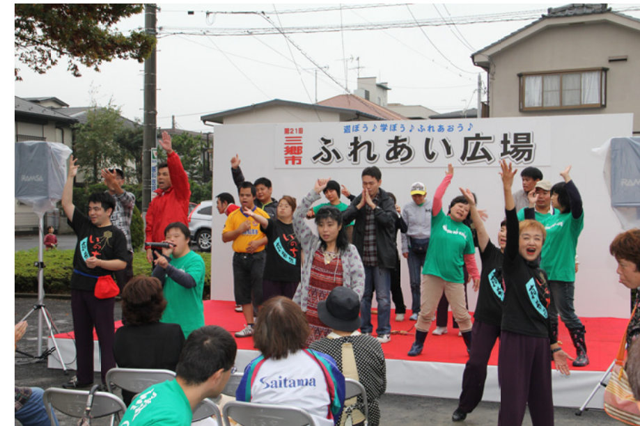
地域で共に生きる「ナノ」によるステージ発表。ステージ上に各団体のメンバーも集結し、歌に踊りに盛り上がりました。