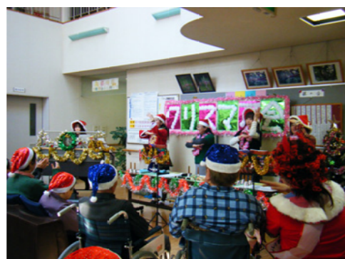
▲“ヤマハjet.あんだんて”のみなさんの演奏を楽しみます♪