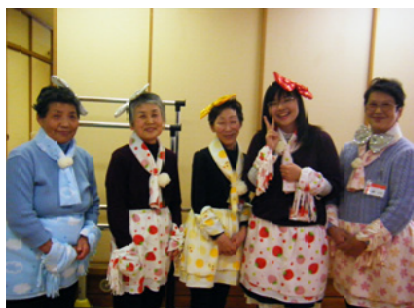
▲活動を支えてくれているボランティアの皆さん

また、戸ヶ崎老人デイサービスセンターでは約20名のボランティアさんが、日常のお話し相手や行事のお手伝いなどで活躍しています。この日は5人のボランティアさんが参加。利用者のかたに寄り添い、クリスマス会と一緒に盛り上げていました。