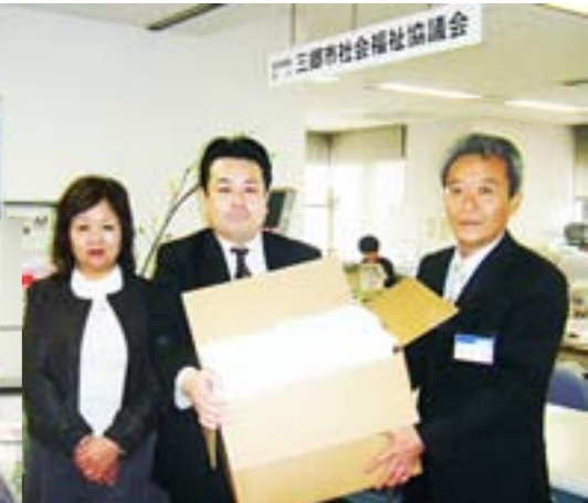
▲毎年たくさんのタオル。ありがとうございます。