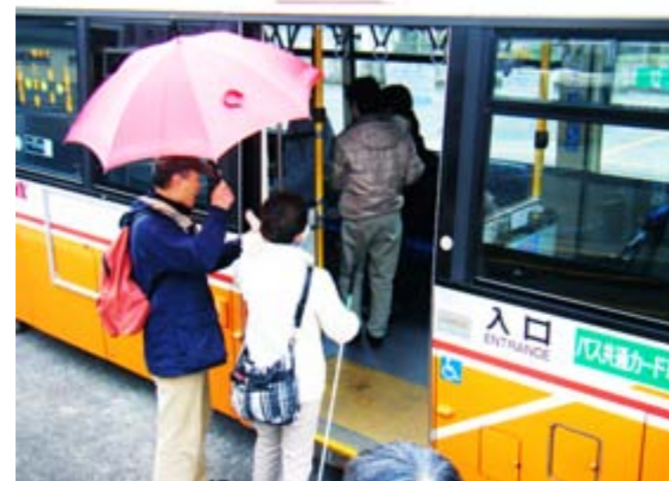
▲雨の日のガイド方法

3月15日(月)、視覚に障がいのあるかたの外出支援(ガイドヘルプ)をしているボランティアグループ「ガイドヘルプ三郷」が、当事者が安心してバスを乗り降りできるようにするために、東武バス三郷営業所のご協力を得て実地訓練を行いました。