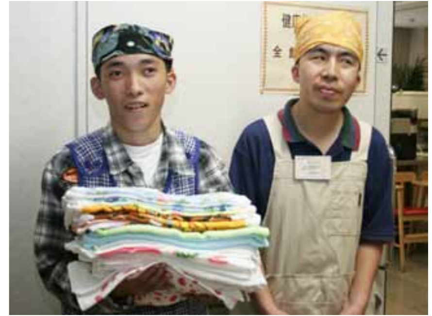
△ タオルを手ににっこり。ひまわりの家の仲間です。