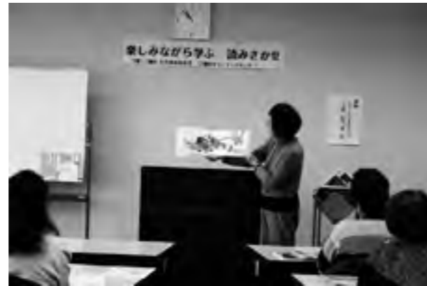
▲参加者が自分で選んだ絵本を読みました。

参加者からは、「読み聞かせの大事なことを教えていただきました」「楽しくなるお話をありがとうございました。基本をきちんと学習でき嬉しかったです」「たくさんのお話を聴き手として体験できたことが何よりの楽しみでした」などの感想があり、とても楽しく学びの深い講座でした。