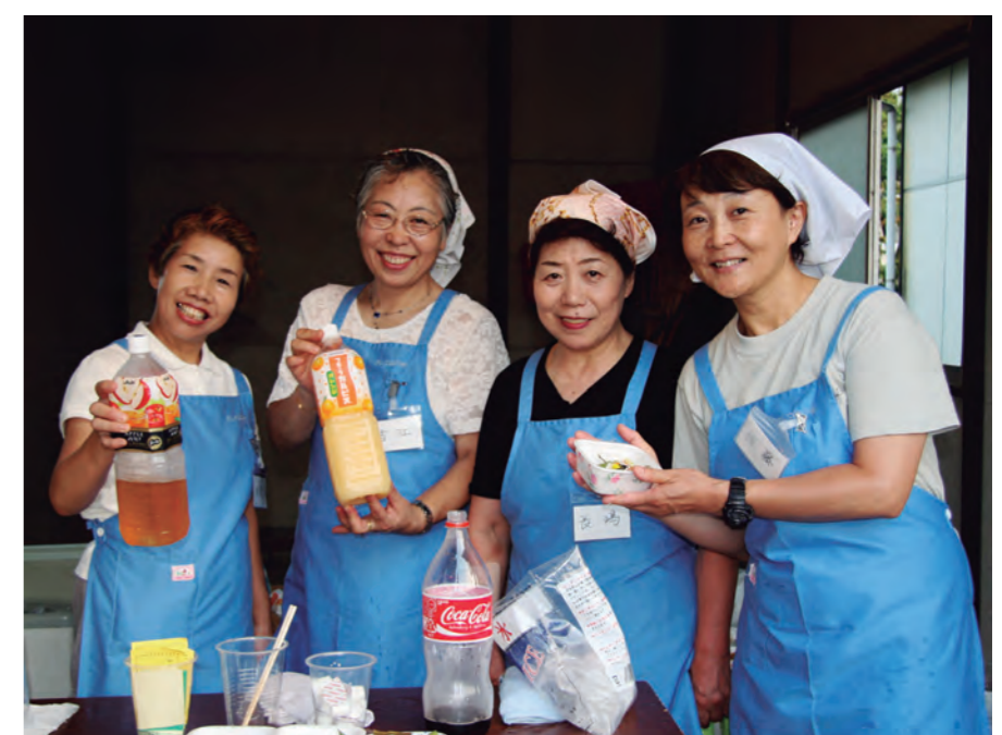
▲ 小鳩園の納涼祭でパチリ(三郷あしたばの会)