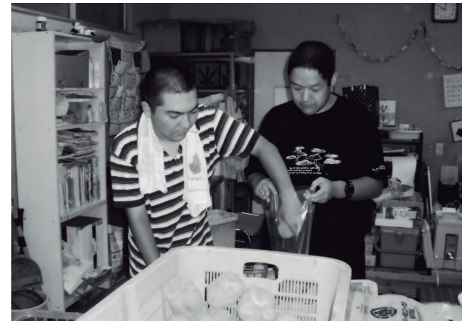
▲頑張ってる作業してます! (ひまわりの家)