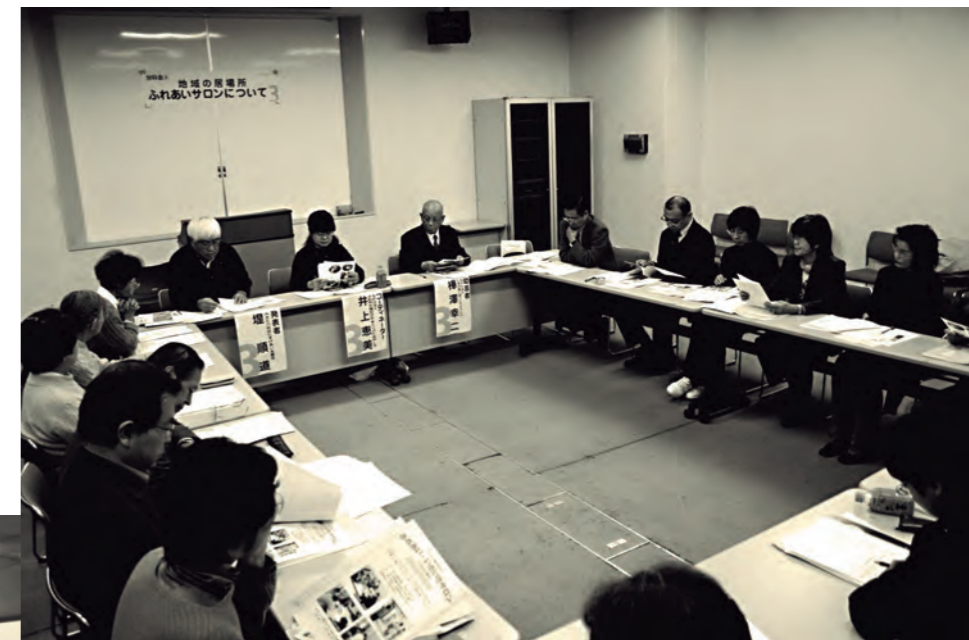
▲平成18年度開催のふくし講座(共同募金配分事業)の様子