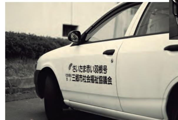
▲共同募金会から配分された「さいたま赤い羽根号」