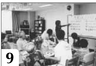
9 書き出された「選べるデザート」から好きなものをおひとつどうぞ