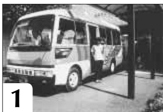
1 みなさんのお迎えに送迎車が出発