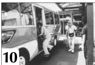
10 あっという間に帰る時間 送迎車に乗り込みます