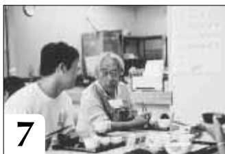
7 できたてのランチを、みなさん一緒に食堂でいただきます