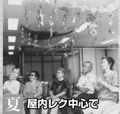
夏 屋内レク中心で