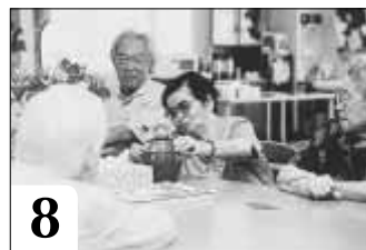
8 昼食後の自由時間 黒ひげゲームにみんなドキドキ