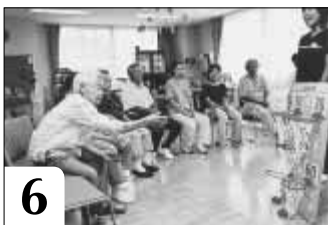
6 この日はボランティアさんと一緒にシュートゲームを行いました