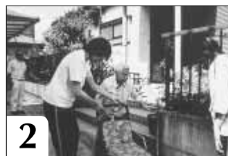
2 おはようございま～す お迎えにあがりました！