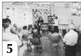
5 レクリエーション前にNHK「みんなの体操」で身体をほぐします