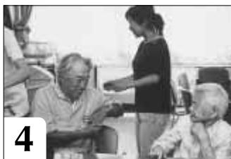
4 お茶を飲みながら一週間の近況報告に花が咲きます