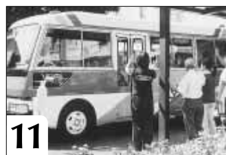
11 お疲れさまでした また来週土曜日に会いましょう