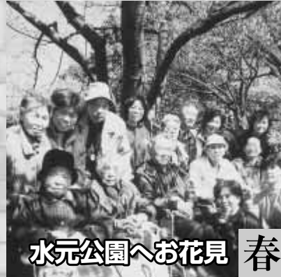
水元公園へお花見 春

いきいき活動通所事業は、屋内でのレクリエーションを中心に活動機会を提供していますが、四季折々のイベントを組み、時には屋外での活動も行っています