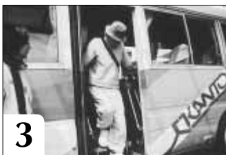
3 デイサービスセンターへ到着