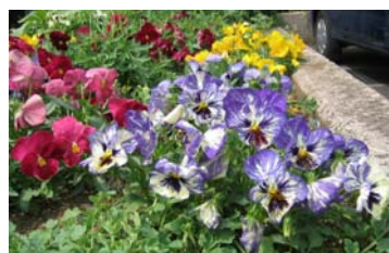
←センター花壇のパンジー

O-157は、口から感染する病原大腸菌です。毒素を産生し、下痢等の症状を引き起こします。 症状は、下痢(水様便)、腹痛、血便等。腹痛と血便のあるときは要注意。 予防は、石けんによる手洗いと食品については、75℃以上の加熱が有効です。台所用品は、流水で流した後、熱湯をかけると除菌できます。