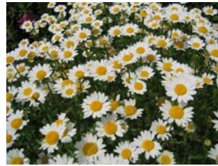
↓センター花壇のノースポール